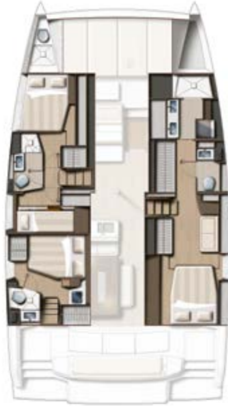
4 CABINS (OWNER) / 3 BATHS VERSION Version 4 cabines / 3 sdb (coque propriétaire)