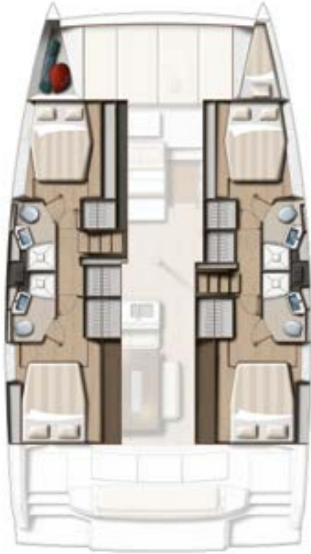
4 DOUBLE CABINS / 4 BATHS VERSION Version 4 cabines doubles / 4 sdb