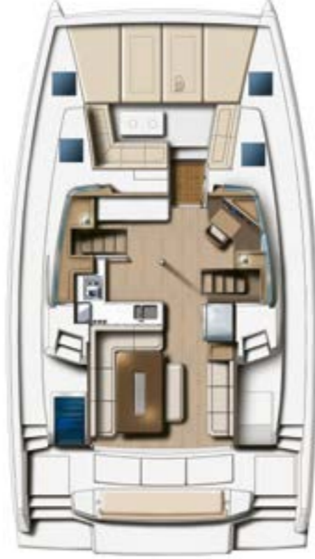
COCKPITS AND SALOON Cockpits & salon