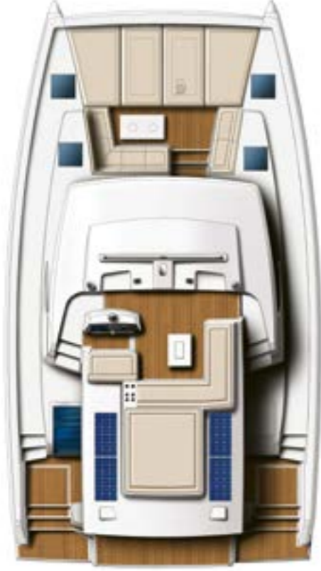
DECK AND FLYBRIDGE (optional teak) Pont et flybridge (teck en option)