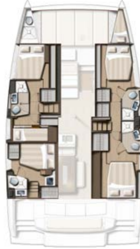
5 CABINS (4 DOUBLE + 1 TWIN) / 4 BATHS VERSION Version 5 cabines (4 doubles + 1 twin) / 4 sdb