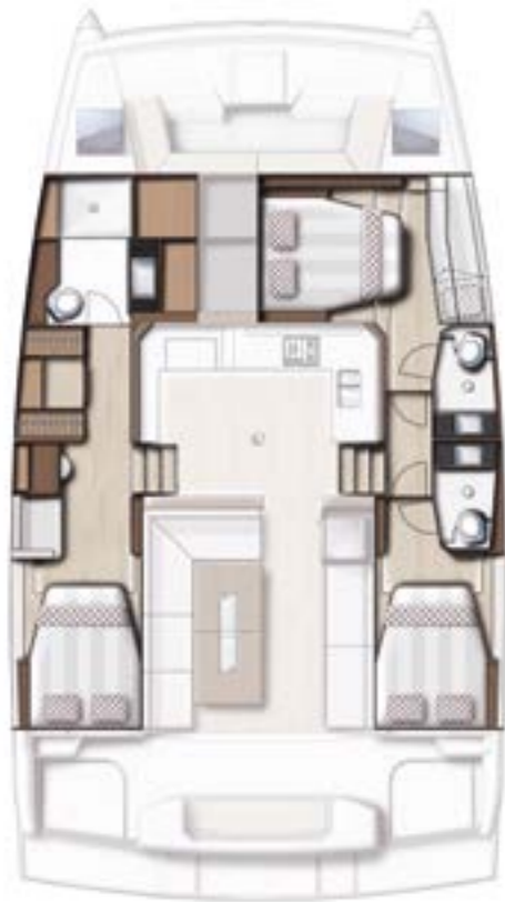
3 CABIN VERSION / 3 BATHS Version 3 cabines / 3 sdb