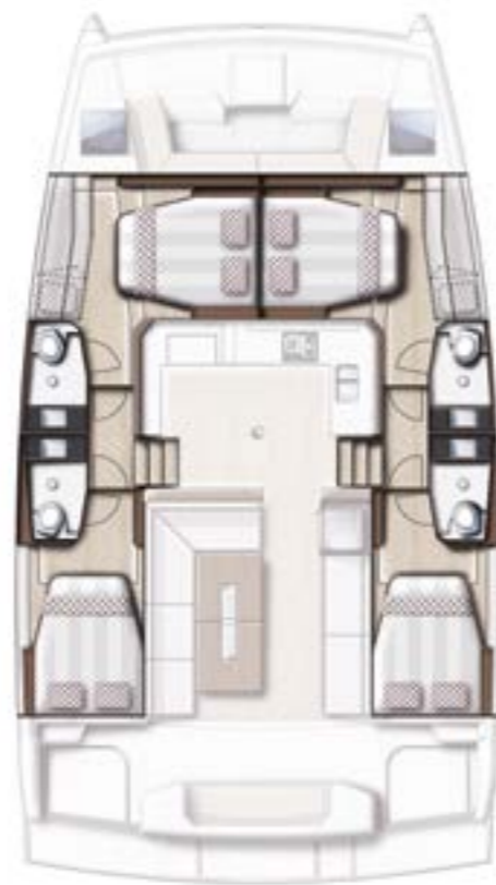
4 CABIN VERSION / 4 BATHS Version 4 cabines / 4 sdb