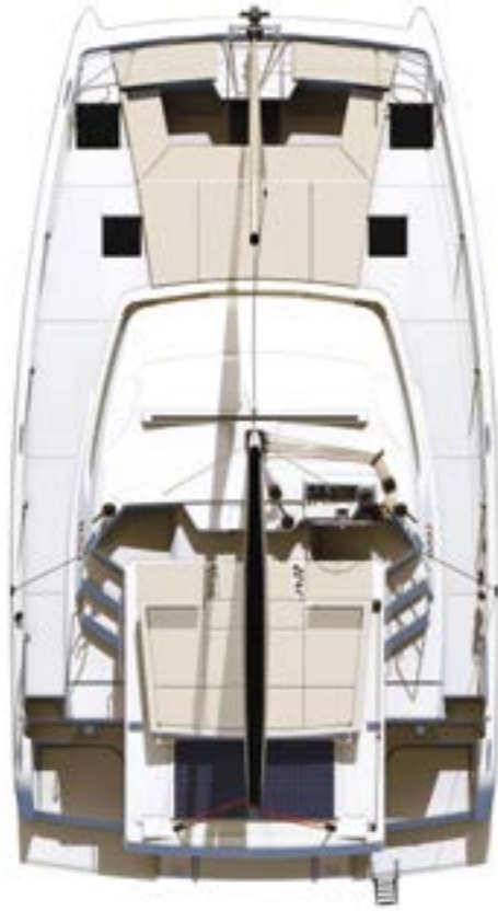
DECK AND FLYBRIDGE Pont et flybridge